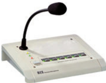
Sprechstelle für mehrere Kreise