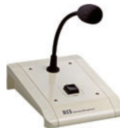
Sprechstelle für einen Kreis